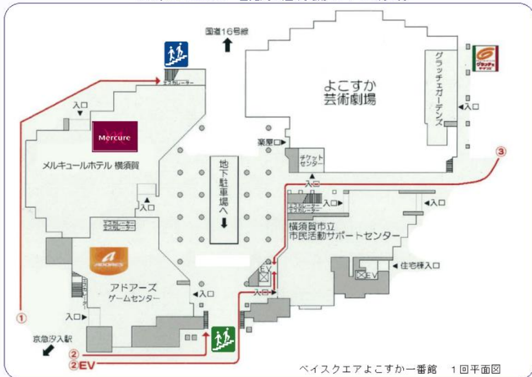
ベイスクエアよこすか一番館 1回平面図