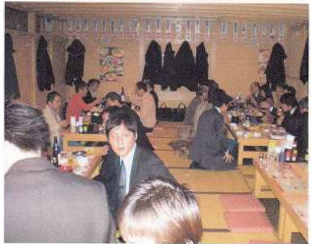
懇親会の様子（さくら水産にて）