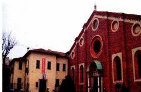
サンタ・マリア・デッレ・グラツィエ教会

15分間は本当にあっという間で、時間になると早く出るよう係りの人に急かされます…。トロトロしていたら、早くするよう注意されました…。ちょっと怖かったです…。