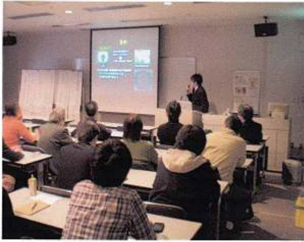
第21回横須賀三浦・南部合同勉強会の様子