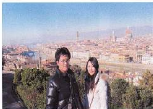
フィレンツェにて

イタリアでは他にも素晴らしい建物や、美しい景色をたくさん見ることができました。特にフィレンツェのドゥオモとカプリ島はすごく綺麗です！！冬のイタリアは思っていたよりも寒くなく、オフシーズンなので観光客も少なく、どこもスムーズに見学することができたので、わたし的にはかなりお勧めです。みなさんも是非一度はイタリアへ☆