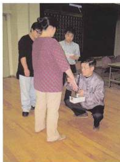
スクリーニング実習中