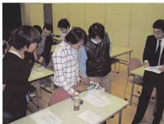
サーベイメータのチェック中