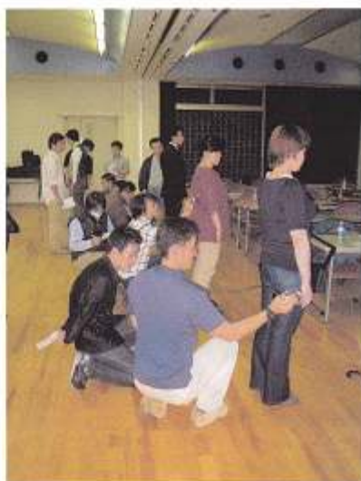
スクリーニング実習中