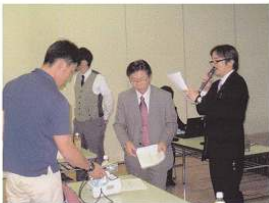
サーベイメータのチェック中