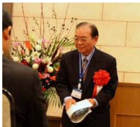
特別功労賞 橋口氏(左)と関野氏(右)