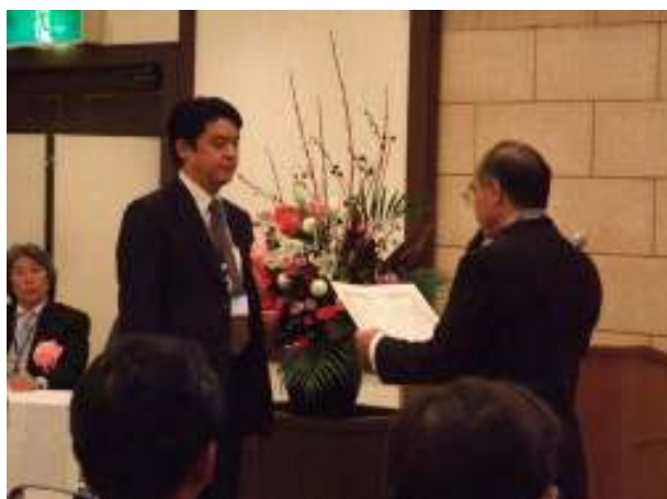
感謝状授与 代表の GEYMS