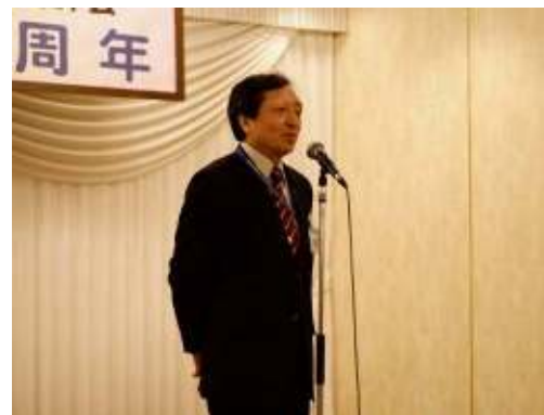
実行委員長の挨拶

* ここに掲載した以外の画像は、横須賀三浦放射線技師会のホームページに掲載予定です。是非そちらをご覧ください。