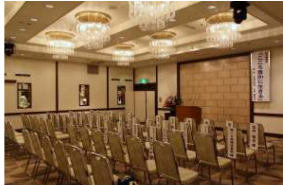
式典会場（セントラルホテル クリスタル）