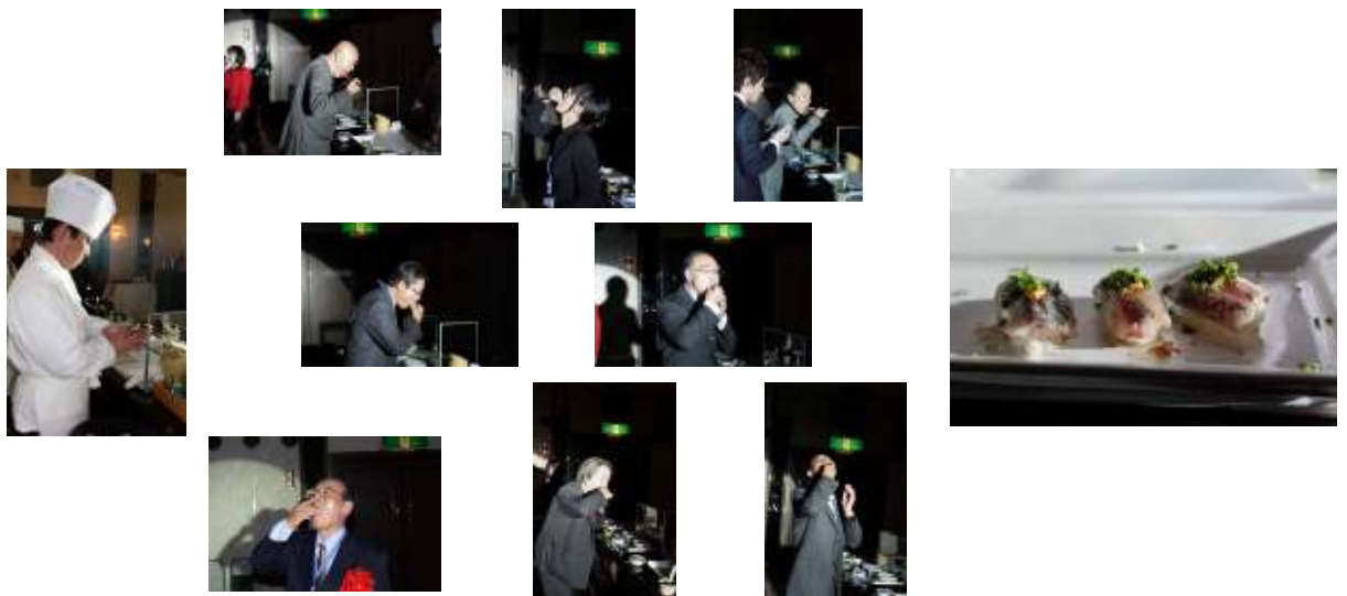
にぎり寿司のパフォーマンス