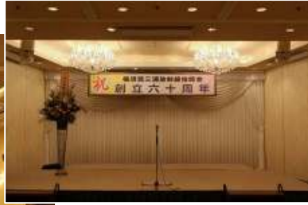
会場はダイヤモンドの間