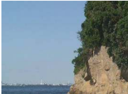
秋晴れの猿島 絶好のBBQ日和でした

10月21日、猿島において、秋晴れのもとバーベキュー大会を行いました。 今回は出足の場所取りから、苦戦をし、危うく昨年の場所を他のグループに取られそうになりましたが、皆さんの協力のもとなんとか、押さえることが出来ました。