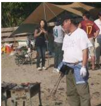
二田管理人による火起こし この方以上の適任者はいるでしょうか？

到着後、早速、恒例の管理人さんのたき火が始まり、また、各々猿島を散策し、魚釣りに興じる方もいました。ビールも島到着後おいしく頂き、バーベキュー開始前には、ほとんどなくなり、もうワンケース買っておけばよかったです。