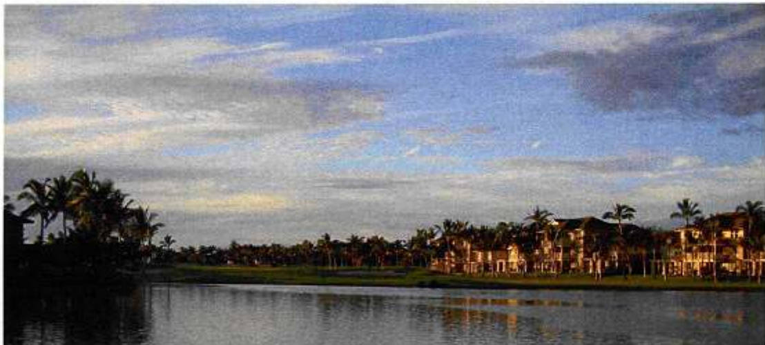
(ハワイ島 ワイコロア)

横須賀・三浦放射線技師会の皆様には、釣り大会ほかいつもお世話になりますが、今後とも小津共々よろしくお願い申し上げます。