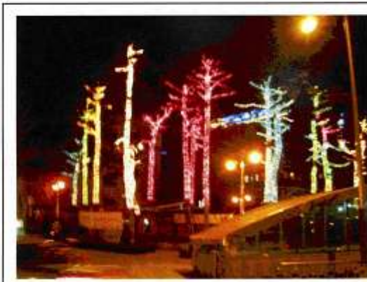
ホテルそばの公園がニョロニョロでライト

コンビニでミネラルウォーターを買って帰った。100円か。そんなに日本とかわらないなあ。ファミリーマートも日本と同じ…つまらんなあ。でも安心するな。