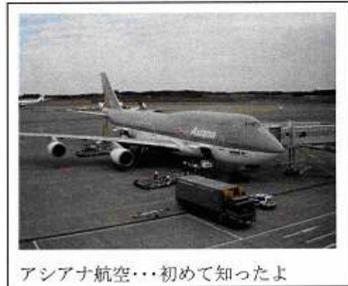
アジアナ航空…初めて知ったよ

1日目はほとんど移動。夕方ホテルに着いてさあ出発。右も左もハングル語でわけわからん。とりあえず、目指すは東大門市場。地下鉄に乗ろうと思って、ガイドブックに載ってた「交通カード」(スイカみたいなやつ)を買おうと思いたち(だって明日もたくさん乗るから)街の交番に聞きに行く。おまわりさんも知らなくて地下鉄乗り場まで案内して買ってくれた(私がお金だしたけど)。ガイドブックには有名って書いてあるのになあ…おまわりさんはイケメンというより日本の自衛隊風のお兄さんだった。