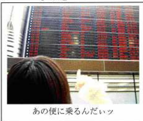
あの便に乗るんだいッ

日本は醤油の臭いがして韓国はキムチの臭いがするらしい。そんなわけで2泊3日の韓国ツアーに行ってきた。自由行動は1.5日。こんな短い期間にどれだけ韓国人になれるか、じゃなくて韓国人の生活を体験できるか、がこの旅の目的。ちなみにアカスリは肌が弱いからパス…。残念!?