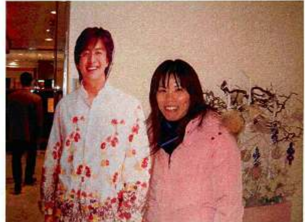
ヨン様と結婚したら苗字は“ペ”ですから～ 残念っ