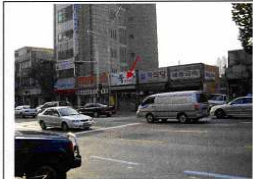
ソウルの朝の風景 矢印のお店がお粥屋

2日目は1日フリー！韓国の朝といったらお粥でしょ。ホテルのフロントのお兄さんに聞くと、これまたハングル語オンリーの店へ。お粥もいろんな種類がありますな。またまたおかずはキムチ〜。しかも白菜だけじゃなくてイカキムチ発見！これが一番お粥にマッチ。日本の塩辛みたいなものかな。なんだ