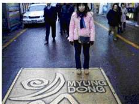
ミョンドンって感じ。